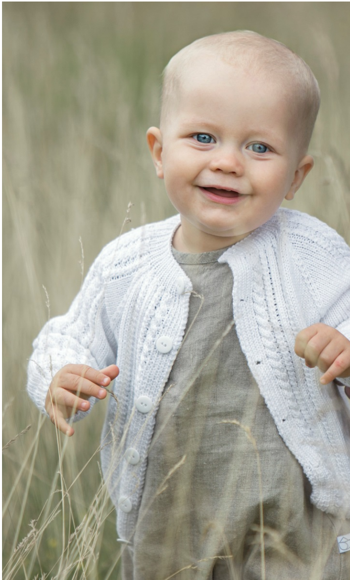
Design: Turid Stapnes